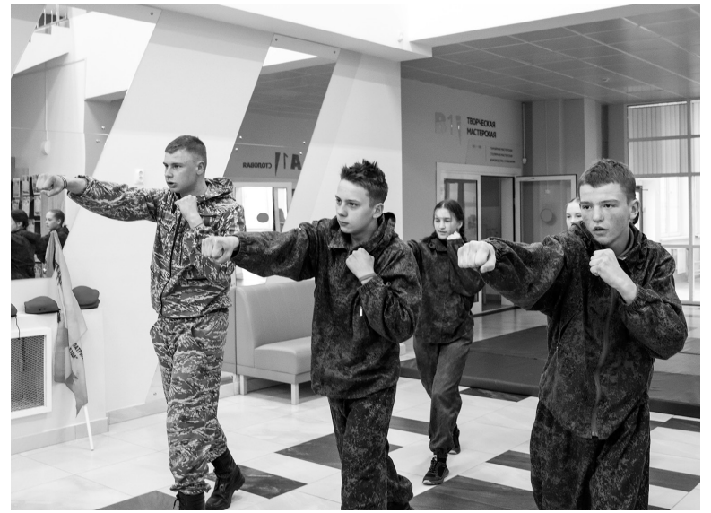
■ Военно-патриотический клуб "Звезда"

После торжественного открытия ребята приняли участие в работе творческих, спортивных, патриотических и информационных площадок. Всего их было шесть: «Юные инспекторы движения» (школа №32), «Дружина юных пожарных» (школа №34), «Юные друзья полиции» (школа №160), военно-патри-