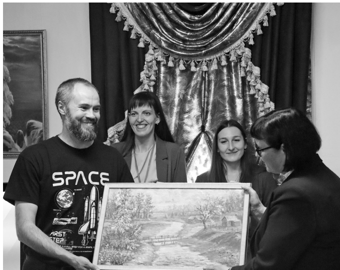
В подарок - новый экспонат

- Надо сказать спасибо людям! Вот хранится у них что-то дома, они приносят это в музей. Без этого бы ничего не было, ни в нашем музее, ни в одном другом, - отметил