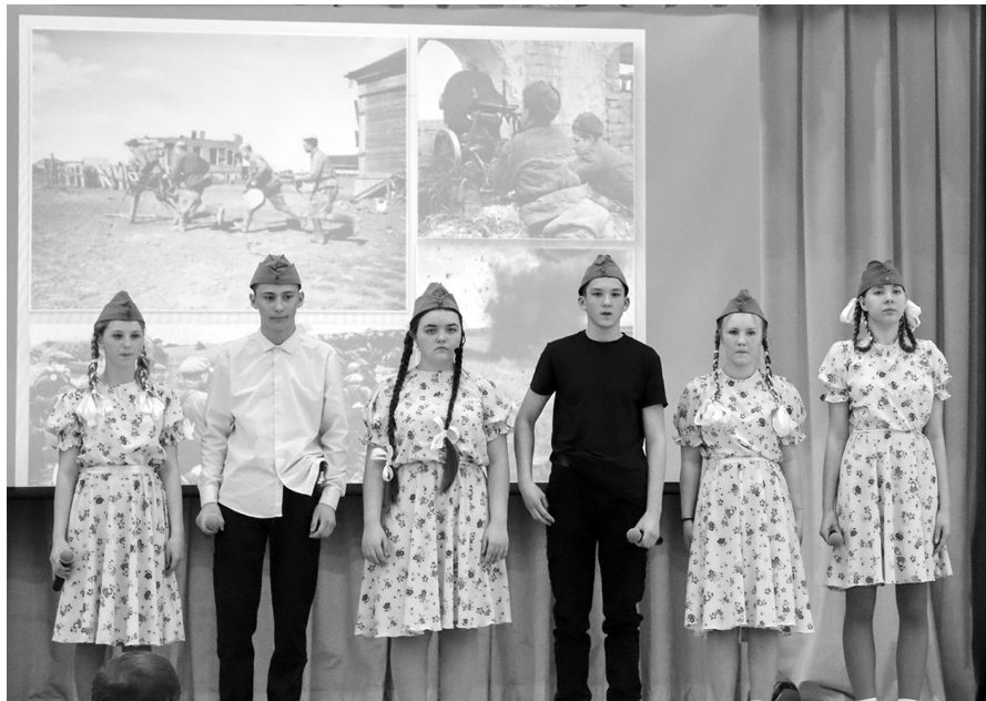
■ Музыкально-литературная композиция «Старое фото»