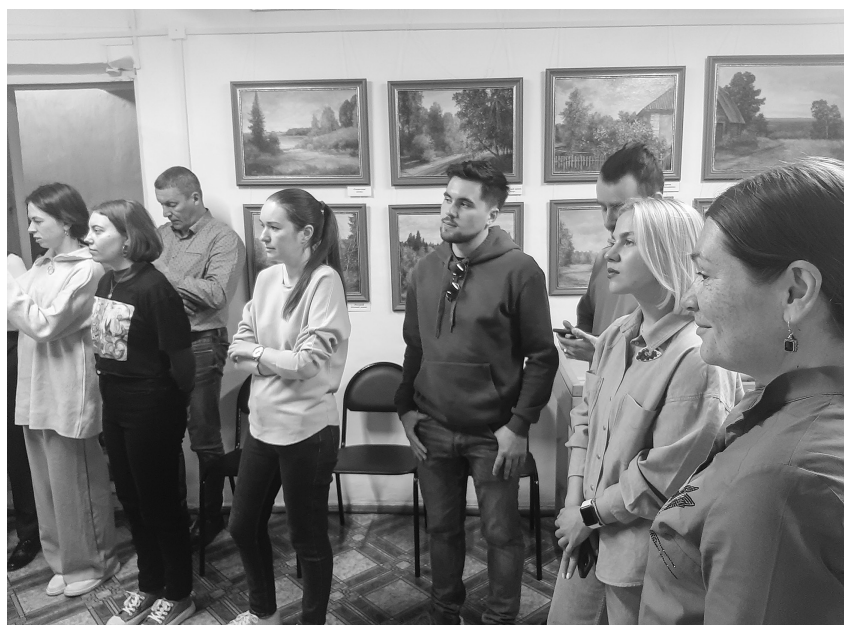
Гости города - работники музеев Кузбасса