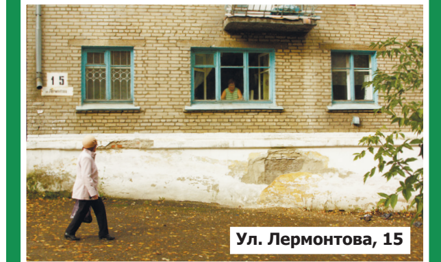
Ул. Лермонтова, 15