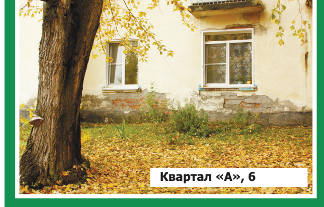
Квартал «А», 6