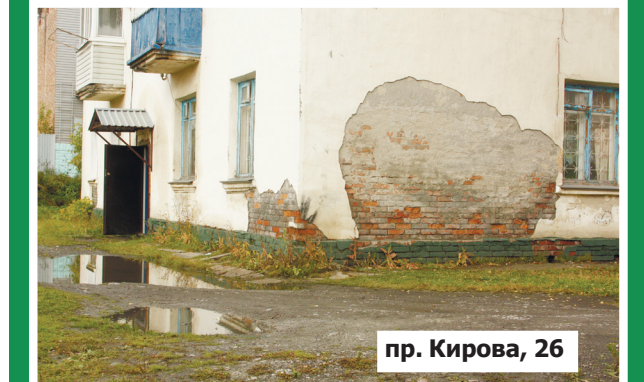
пр. Кирова, 26