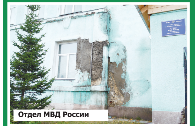
Отдел МВД России