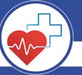
ГРАФИК ВЫЕЗДНЫХ ПРИЕМОВ ВЕДУЩИХ СПЕЦИАЛИСТОВ ОБЛАСТНЫХ КЛИНИК

Многопрофильная клиника «МЕДИЦИНСКАЯ ПРАКТИКА»