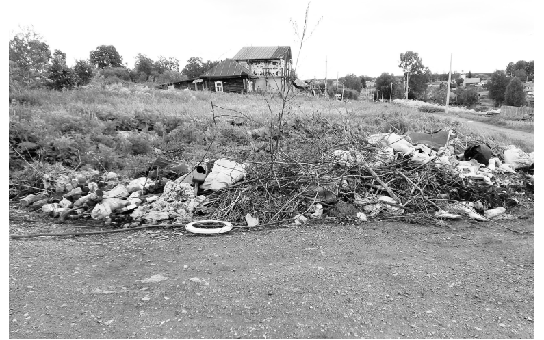
■ ул. Нечая и пер. Пожарный

Так, в ходе очередной проверки, проведенной прокуратурой города в мае 2019 года, выявлено 4 нарушения закона об отходах производства и потребления. Несанкционированные свалки твердых бытовых отходов выявлены на пересечении ул. Нарымская и ул. Кедровая, ул.