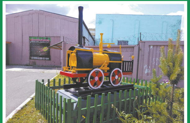
Паровозик на территории кафе «Чинар»