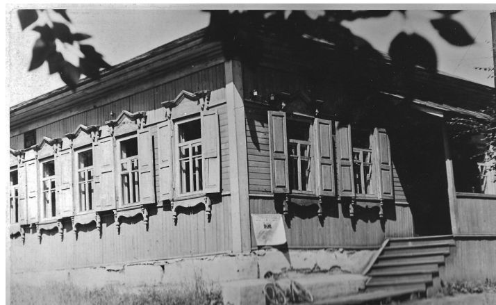
■ Первое здание городской библиотеки

80 лет - солидная цифра, это целая большая жизнь, история интереснейших дат и событий. Именно столько лет исполняется городской библиотеке.