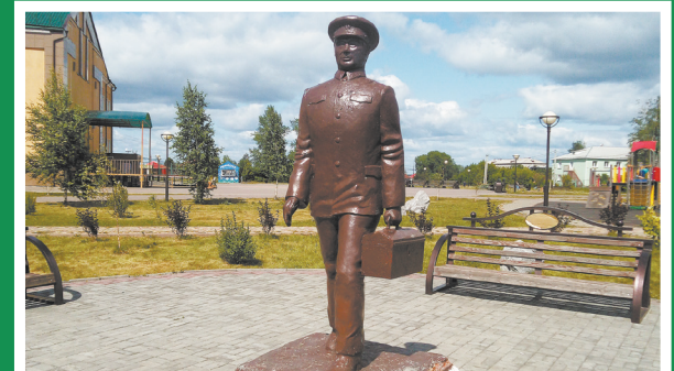
Памятник машинисту в парке «Юбилейный»