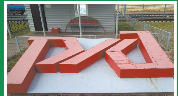
Логотип ОАО «РЖД» на территории станции