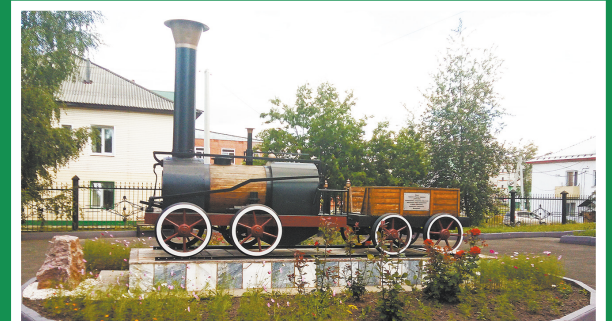
Макет первого в России паровоза около здания дортехшколы