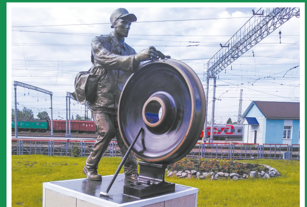
На территории эксплуатационного вагонного депо