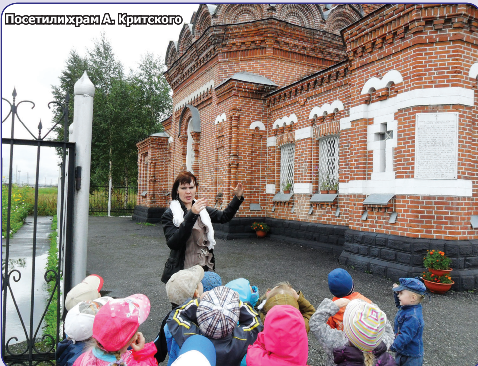
Посетили храм А. Критского