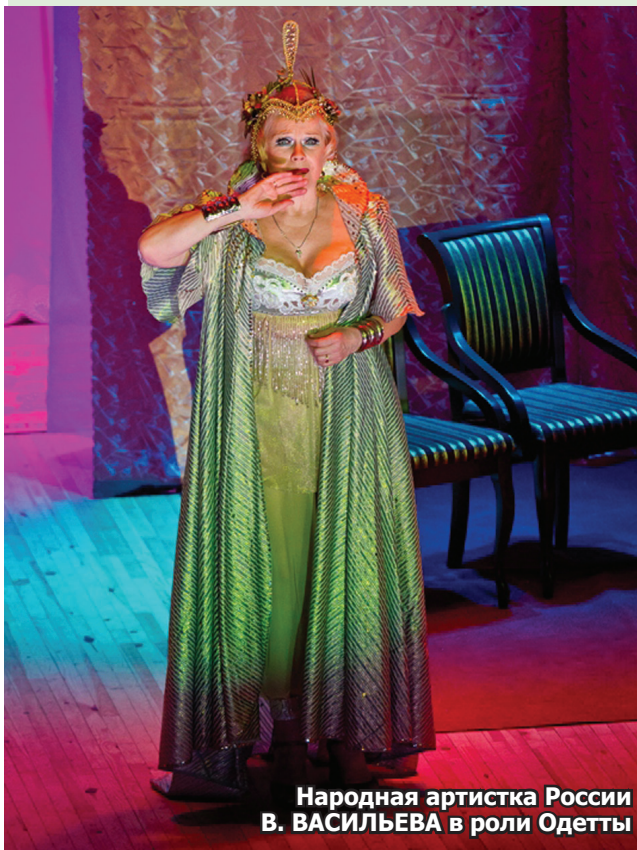
Народная артистка России В. ВАСИЛЬЕВА в роли Одетты