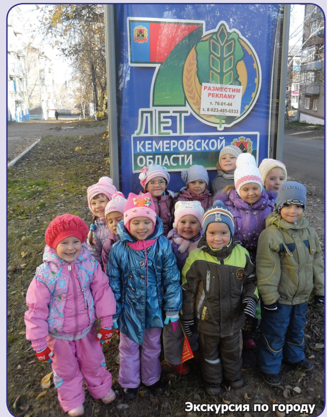
Экскурсия по городу