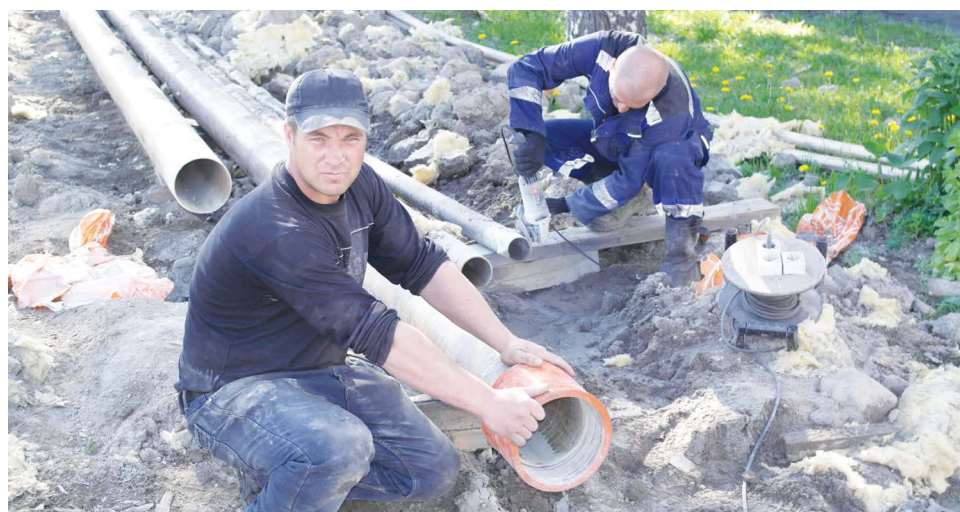
■ Ведётся укладка труб