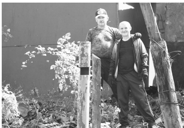
■ Участники субботника

В редакцию обратилась жительница одного из частных домов по ул. Чкалова. Территория её, участка граничит с гаражами по ул. Октябрьской, где между ее забором и гаражами образовалась стихийная свалка. Муж у женщины инвалид, а сама она физически не способна убрать скопившийся за несколько лет мусор.