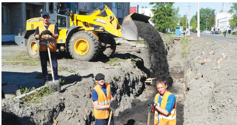
■ Производится отсыпка теплотрассы

С 14 июня по 14 июля реклама в газете со скидкой