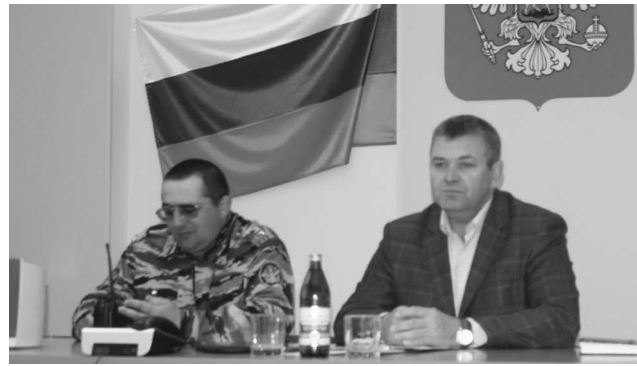
■ В ЛИУ 21

Сотрудники учреждений смогли задать главе города волнующие их вопросы. А это ремонт кровли, установка детской игровой площадки, очист-