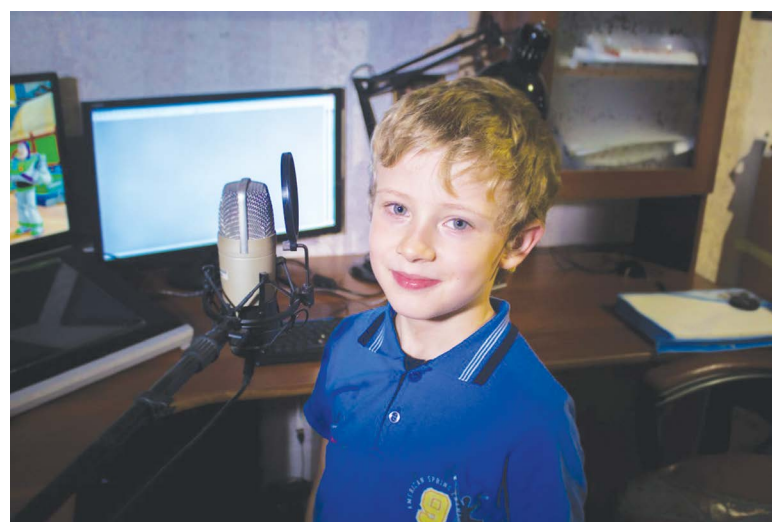
■ Озвучивание мультфильма