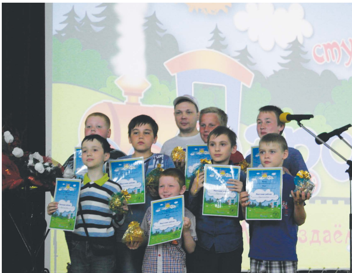
■ Группа «Гром»

Во вторник впервые в нашем городе прошел фестиваль анимационного кино. В этот день воспитанники мультипликационной студии «Паровозик» представили свои работы, а также первые выпуски юмористического киножурнала «Юморенок».