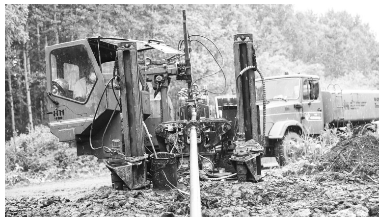
■ Прокладка водовода