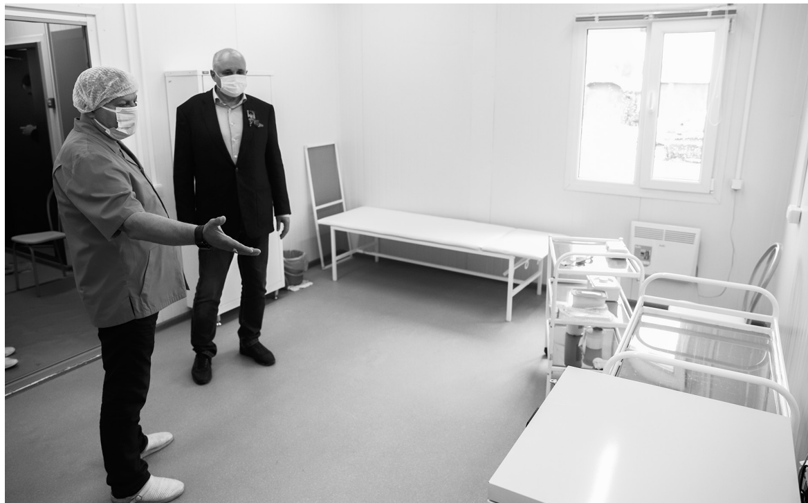
■ Осмотр ФАПа в поселке Таёжный

Губернатор Кузбасса С.Е. Цивилев в минувшую пятницу посетил Тайгинский городской округ.