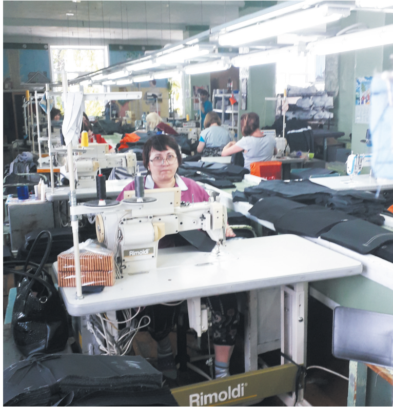
■ Швейный цех

Не стоит на месте производство и с мая текущего года швеи