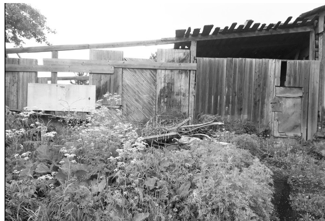
■ По ул. Тракторная

В южной части города возле одного из домов хозяева складировали у забора трубы. Видно, что приготовили их для даль-