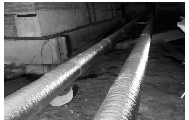
■ Восстановлена изоляция труб в подвале