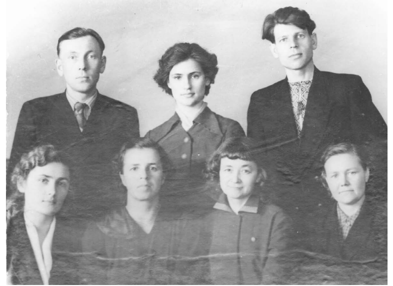
■ Педагогический коллектив 1958 г.