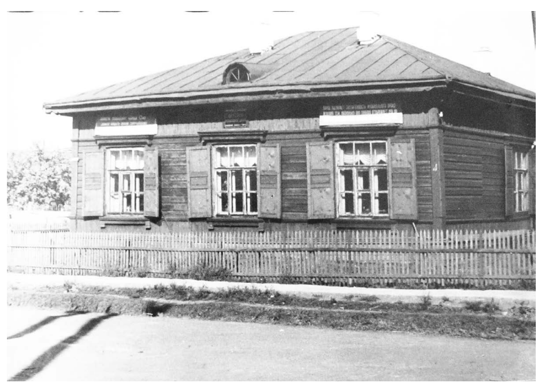
■ Здание школы 1956 г. по улице Перееззная