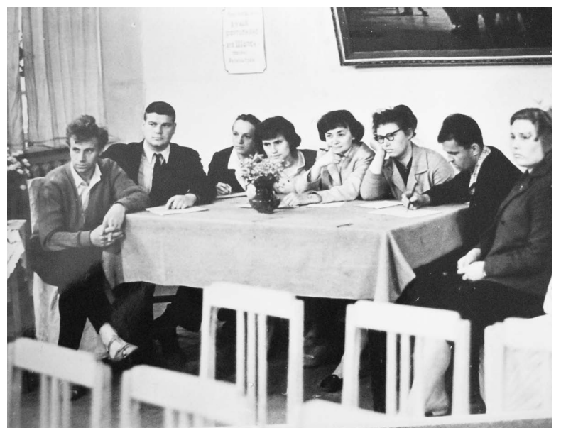
■ Экзаменационная комиссия