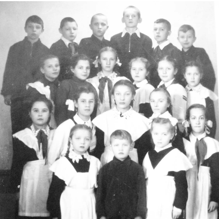
■ Первые ученики