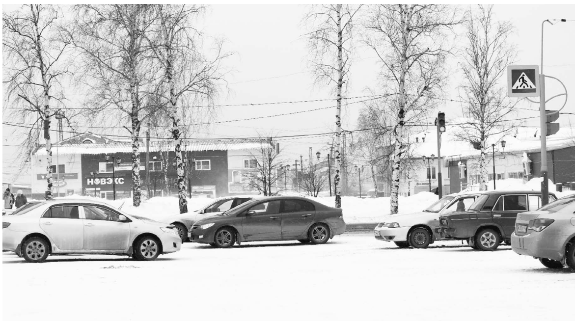
■ «Парковка» на городской площади

Предложение для тайгинских активистов: может быть, вместо того, чтобы бесконечно жаловаться в различные инстанции, лучше навести порядок в городе. И возможно благодаря совместной работе ГИБДД и общественности водители научатся уважать пешеходов и соблюдать правила дорожного движения!