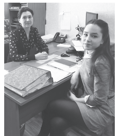
■ В отделе потребительского рынка

Во второй половине дня все участники дня с властью приняли участие в штабе по финансовому мониторингу. Ребята узнали, какие меры принимаются в отношении должников по на-