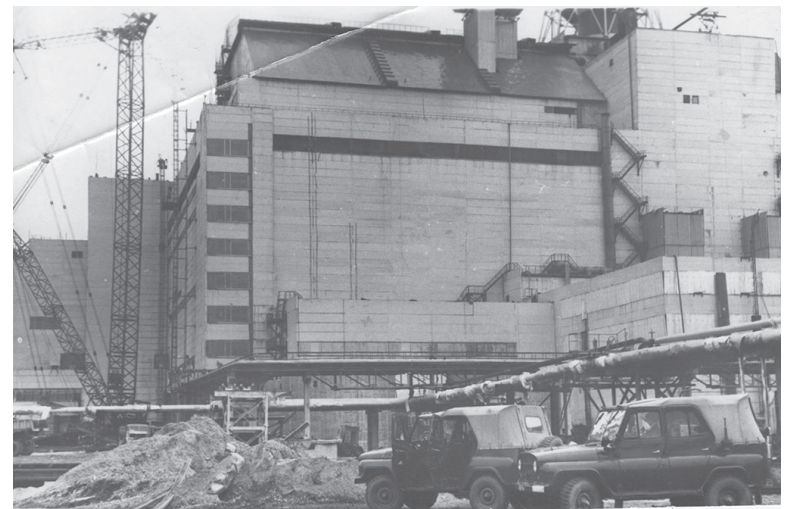
■ Чернобыльская АЭС

Дружба эта возникла по инициативе областного «Союза «Чернобыль». Организация существует на членские взносы. Тайгинские «чернобыльцы»