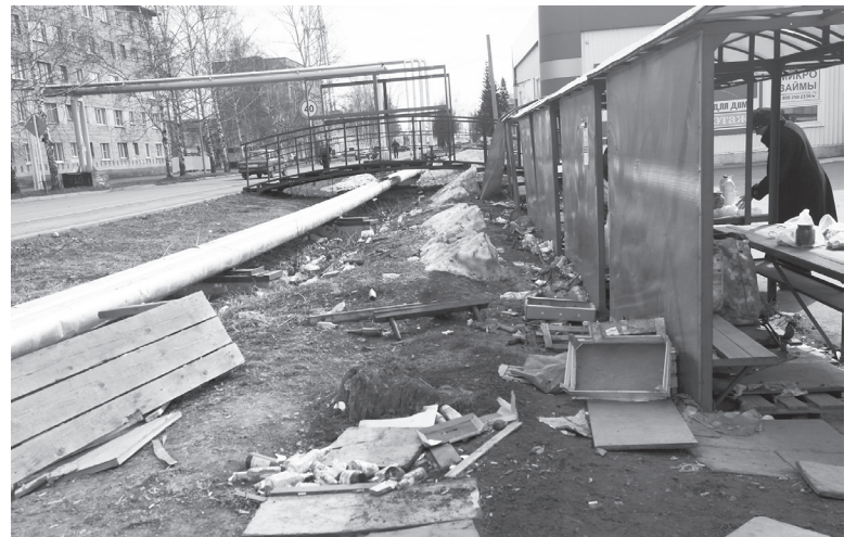
■ Территория возле торговых рядов на пр. Кирова