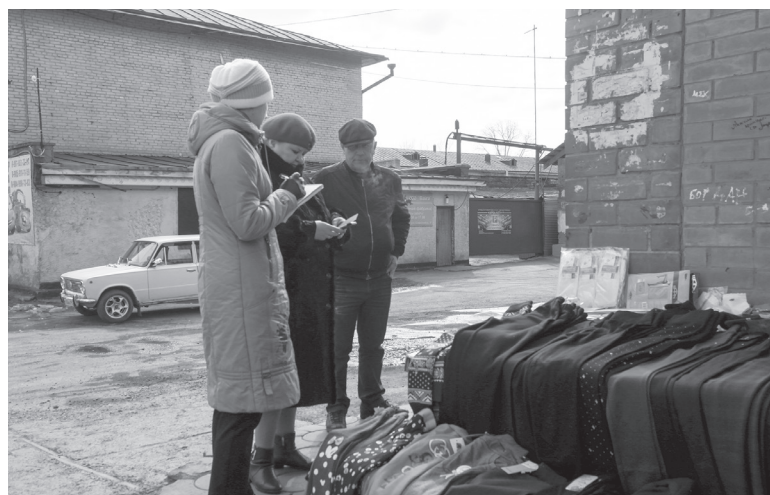
■ На ул. Интернациональная